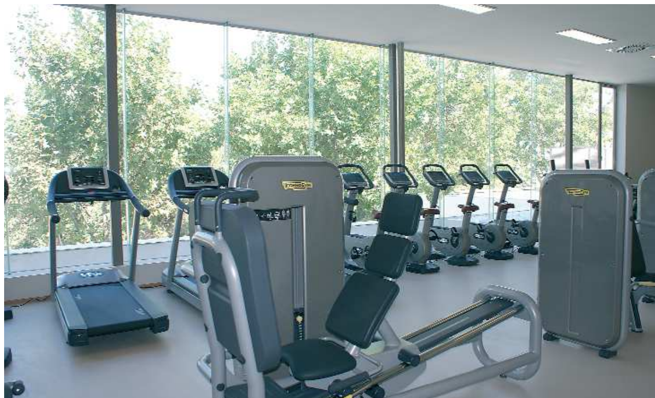
Máquinas de musculación con las que se ha equipado una de las nuevas salas del polideportivo municipal Ramón Sáez.

> Después de varios meses de obras, el 13 de noviembre se inaugurará oficialmente la remodelación del polideportivo municipal Ramón Sáez, en la que se ha invertido más de 4 millones de euros. Previamente, el 22 de octubre, coincidiendo con la presentación de los equipos del Club Atlético del barrio de La Luz, se inauguró el césped artificial del campo de fútbol 11 de este barrio, en una intervención que ha incluido también nuevos postes parabalones, una nueva caldera en los vestuarios, así como bancos para el público y la colocación de hormigón im-