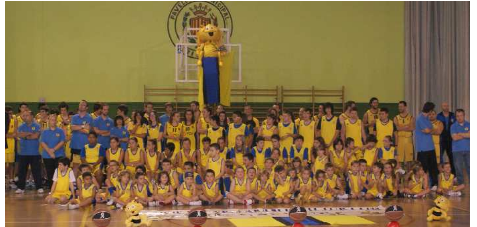
Club Bàsquet Xirivella