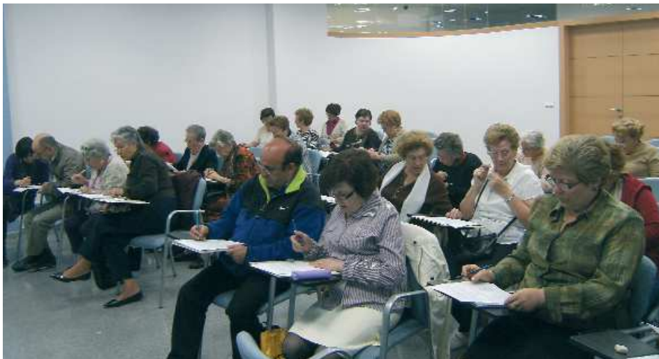
Activitats de Majors. Taller de la Memòria al Centre Municipal Samarra