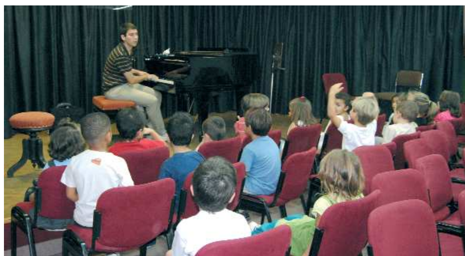
Escola Municipal de Música, coral infantil Nacarella