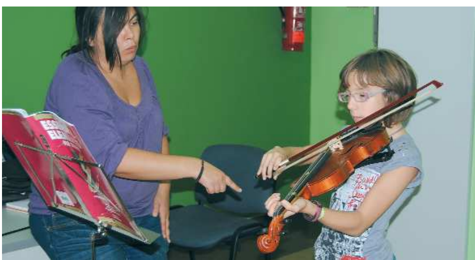
Escola Municipal de Música, classe de viola