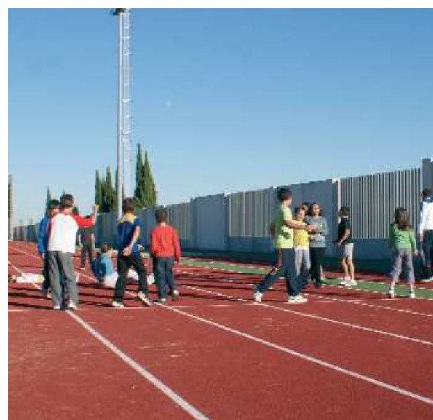
Las pistas de atletismo, detrás del campo de fútbol del polideportivo.

preso en los accesos. También los jugadores del Xirivella CF han estrenado con la nueva temporada el césped artificial del campo de fútbol 11 del polideportivo municipal. Además, la remodelación del Ramón Sáez ha incluido la construcción de un módulo de atletismo, las gradas del campo de fútbol, nueva cafetería y vestuarios, la piscina de chapoteo, una sala de fitness y otra de musculación, dos pistas de pádel, la reforma de aseos así como la pavimentación, el vallado, la iluminación y la jardinería en los recorridos peatonales y la demolición de los frontones más