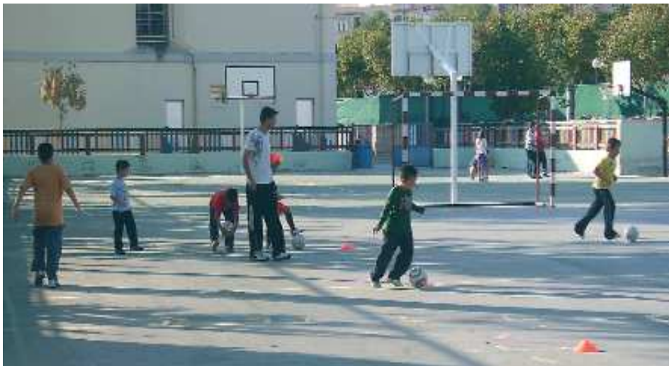
Escoles Esportives Municipals. Futbol Sala