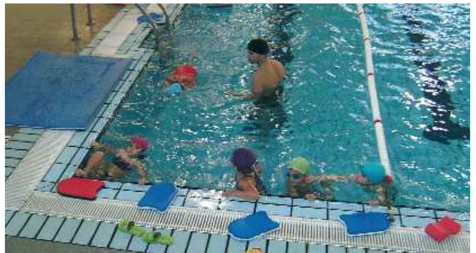
Escola Esportiva Municipal de Natació