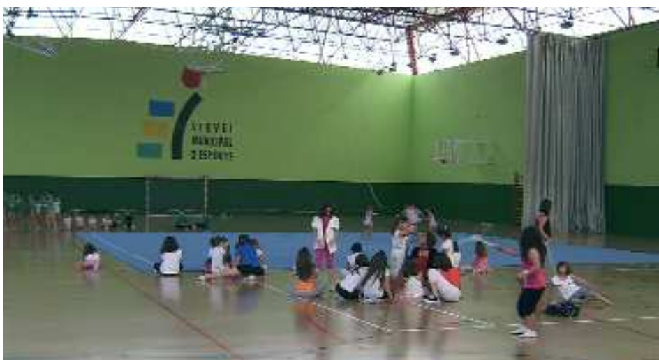
Escoles Esportives Municipals. Gimnàstica rítmica al pavelló cobert