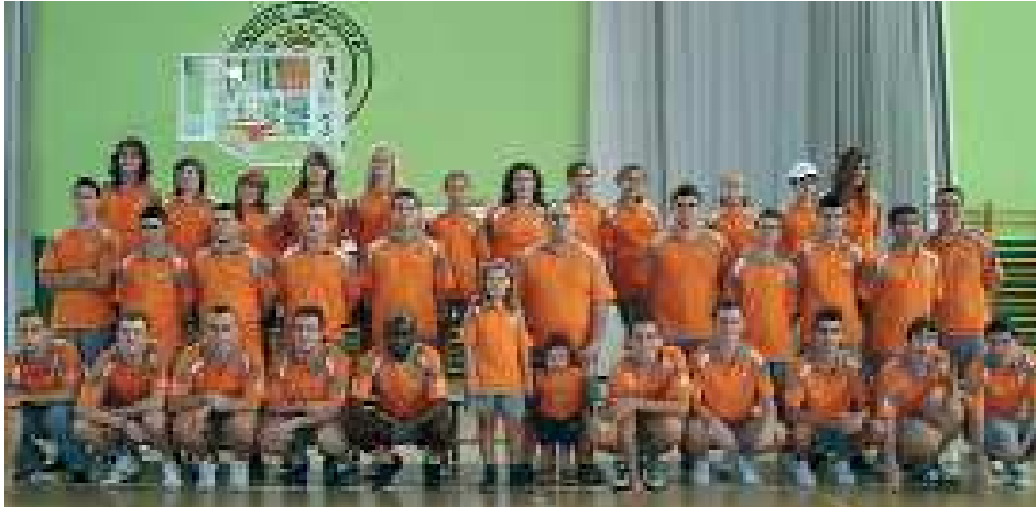
Club Solymar Xirivella Futbol Sala