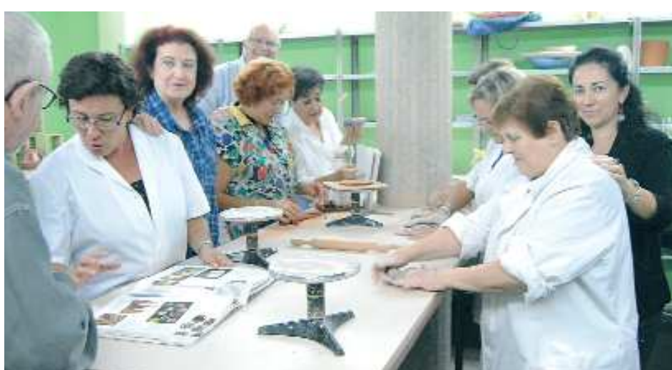
Taller de Ceràmica de la Casa de Cultura