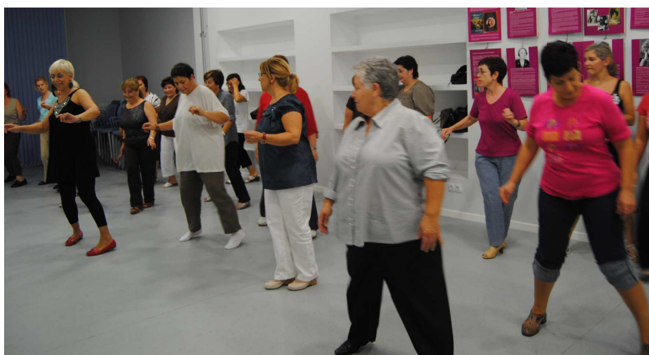
Taller de Balls de saló a la Casa de la Dona