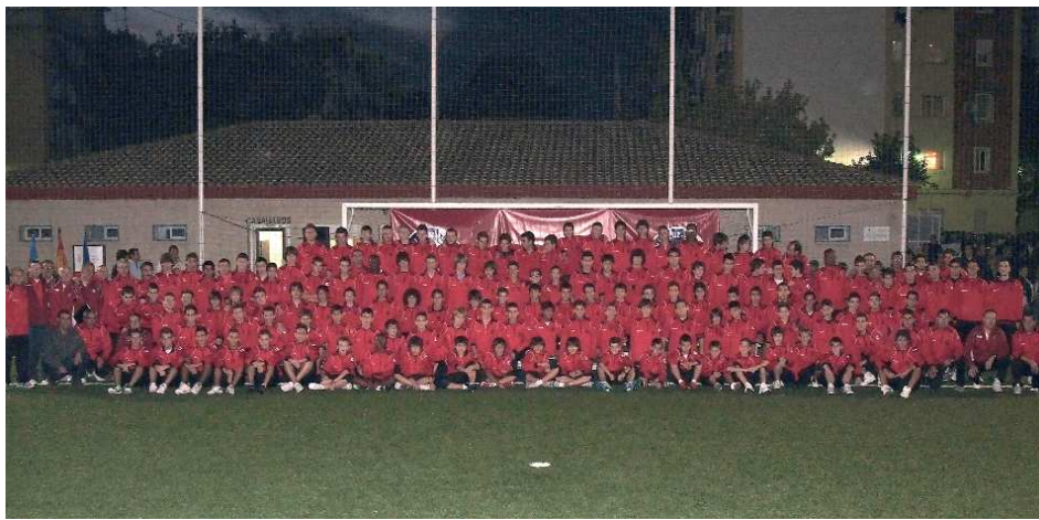
Club de Fútbol Atlético Barrio de la Luz-Xirivella