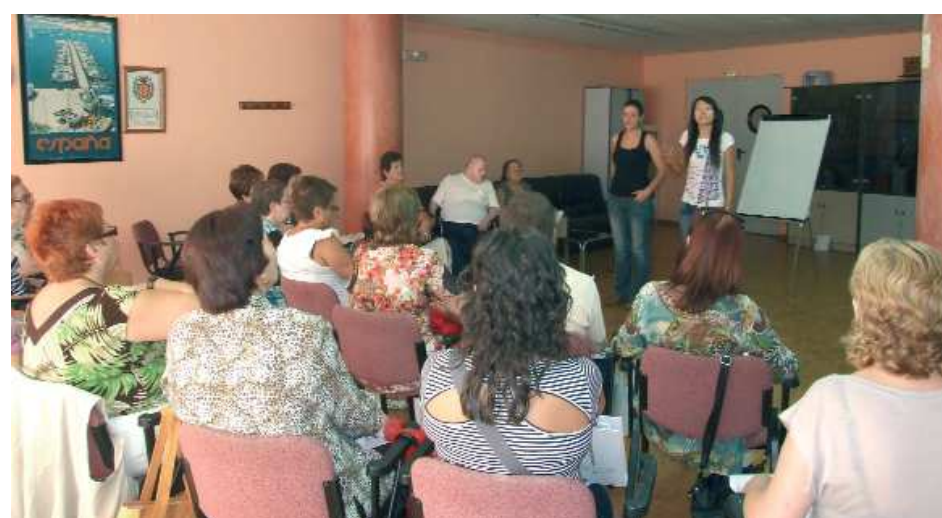
Centre Social Polivalent, curs per a cuidadors no professionals de dependents