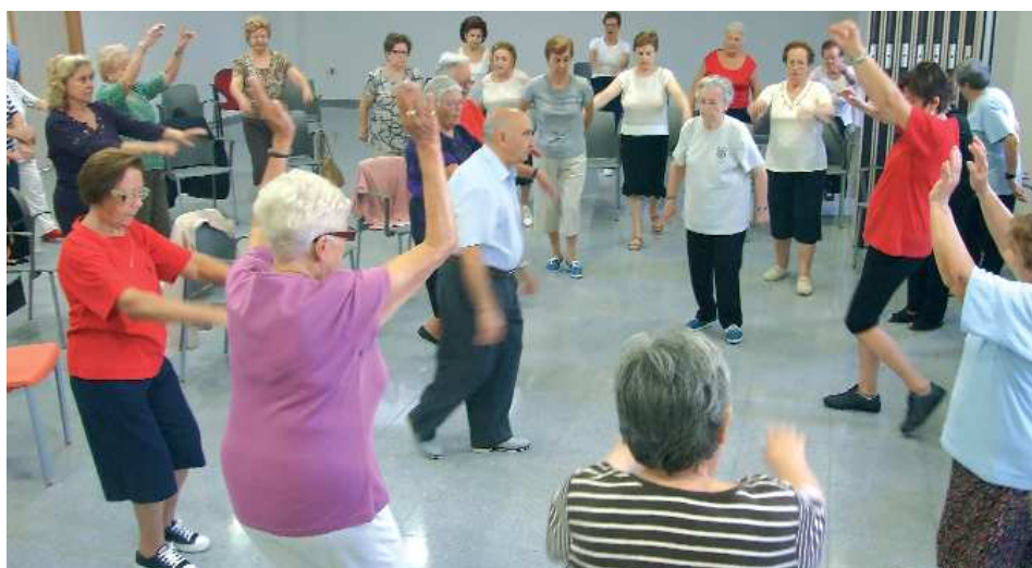
Activitats de Majors. Gerontogimnàstica al Barri de la Llum