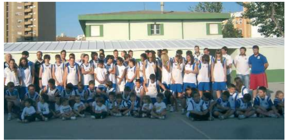
La Llum Bàsquet