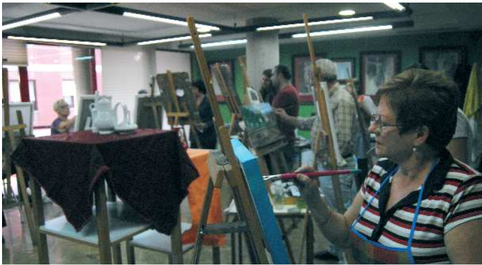
Taller de pintura a la Casa de la Cultura