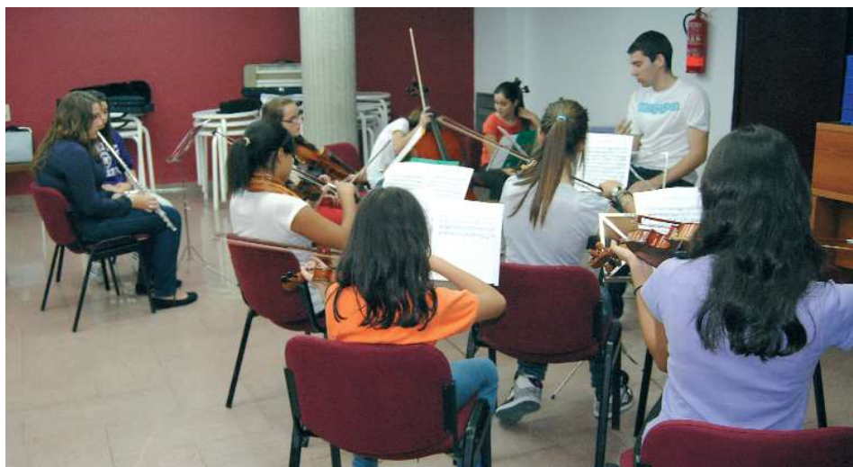
Escola Municipal de Música, orquestra Xirivita Xiritata