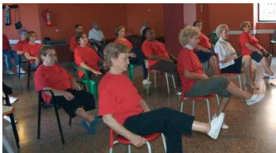
Activitats de Majors. Gerontogimnàstica al Centre punt.Com