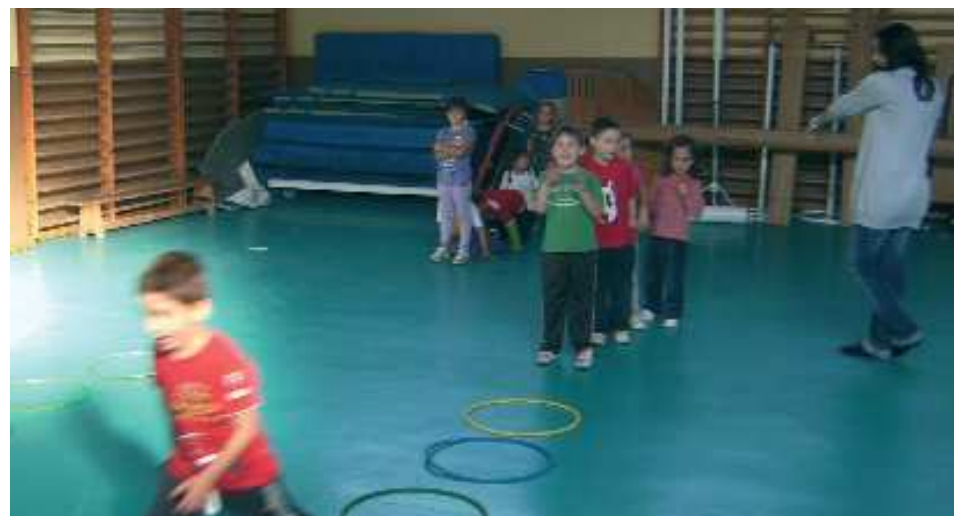
Escoles Esportives Municipals. Multiesport al col·legi Cervantes