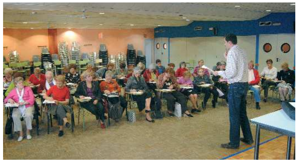
Activitats de Majors. Taller Majors al Dia al Centre Social Polivalent