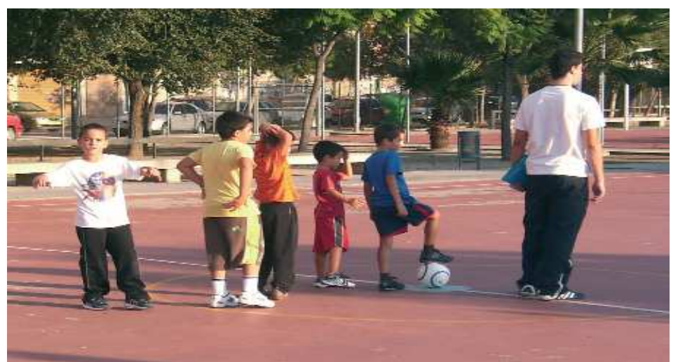
Escoles Esportives Municipals. Futbol al Poliesportiu del Barri de la Llum